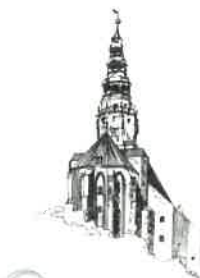
Katedra Diecezji Świdnickiej