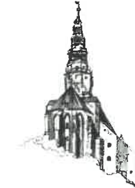
Kościół pw. Św. Stanisława i Św. Wacława Katedra Diecezji Świdnickiej

Sporządziła: insp. Alicja Marut (74) 856 28 66