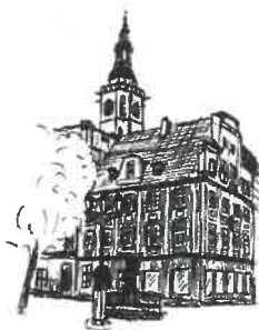
Rynek Wieża ratuszowa