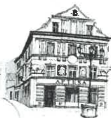
Kamienica „Pod Bykami”