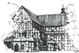
Kościół Pokoju pw. Św. Trójcy Wpisany na listę UNESCO