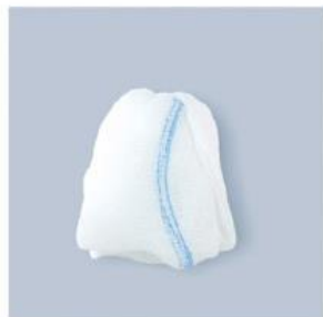
TUPFER ER KAPTUR