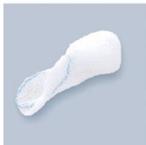
TUPFER BR FASOLKA