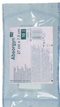
TPF torebka papierowo- foliowa wyrób jałowy