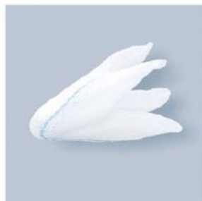
TUPFER CR SĄCZEK