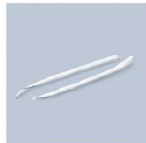
TUPFER LR LARYNGOLOGICZNY