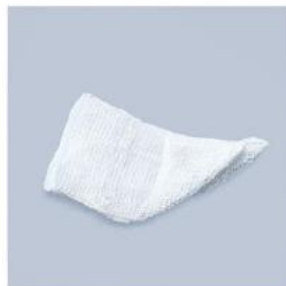
TUPFER H PAPRYKA