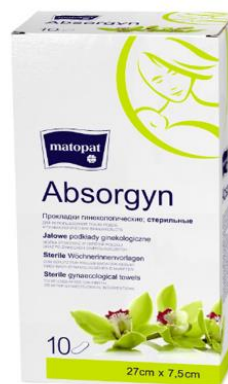
KAR kartonik pośredni, a w środku TPF wyrób jałowy