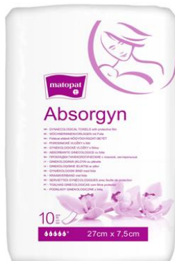
WOR opakowanie foliowe z otwieraniem typu flip- top wyrób niejałowy