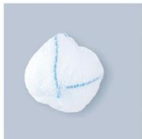
TUPFER AR KUŁA