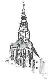
Kościół pw. Św. Stanisława i Św. Wacława Katedra Diecezji Świdnickiej