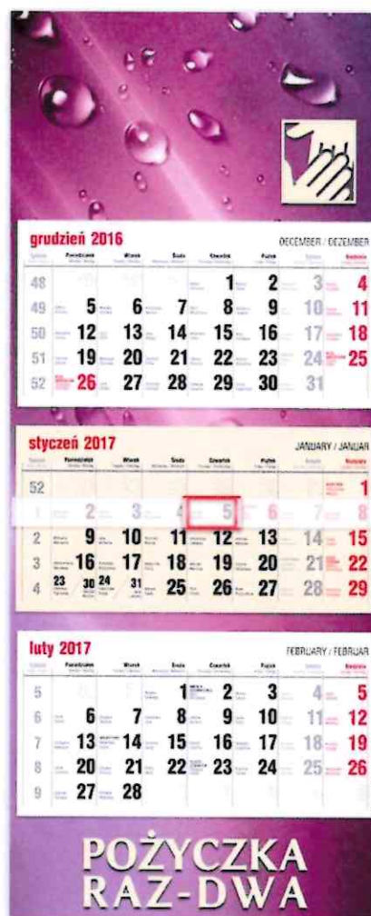
Kalendarz trójdzielny CLASSIC z nadrukiem na słupce