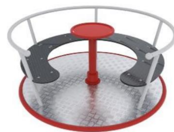
Przykładowy widok urządzenia