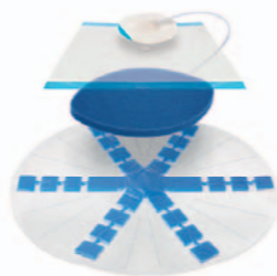
ABTHERA™ SENA T.R.A.C.™ Open Abdomen Dressing M8275026/5