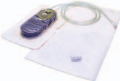
PEEL & PLACE™ Dressing 13 cm 18,4 x 6,4 x 1,8 PRE1155