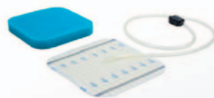
SNAP™ Advanced Dressing Kit - Medium 15 x 15 cm SKTF15X15