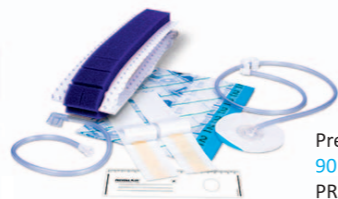
Prevena CUSTOMIZABLE 90 cm 90 x 6,4 x 1,8 cm PRE2055