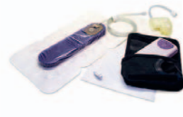
PREVENA™ PEEL & PLACE™ Kit 20 cm 25,4 x 6,4 x 1,8 cm urządzenie PREVENA™ 125 Therapy Unit (czas pracy 8 dni), 45 ml zbiornik. PRE1001

Zestaw opatrunkowy do stosowania na zamkniętą ranę zawiera: