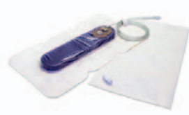
PEEL & PLACE™ Dressing 20 cm 25,4 x 6,4 x 1,8 cm PRE1055